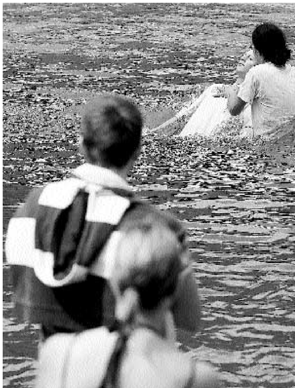
Ein Anhänger von ICF lässt sich im Eichholz in der 14 Grad kalten Aare taufen.

«Viele schliessen sich der Gemeinde an, die gerade in Mode ist», führt Schmid weiter aus. Das Mot-